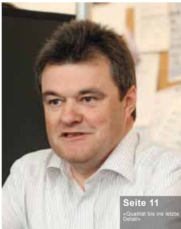
Seite 11 «Qualität bis ins letzte Detail»