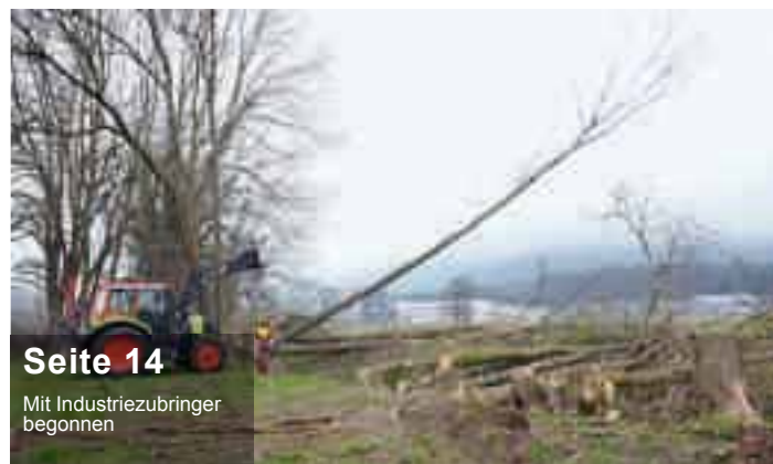
Seite 14 Mit Industriebubringer begonnen