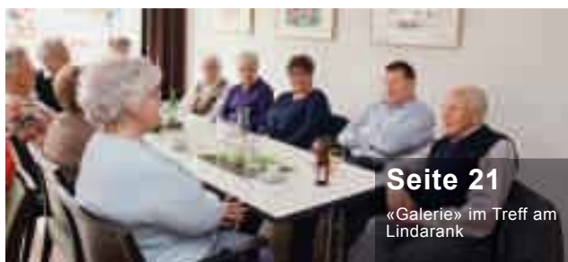
Seite 21 «Galerie» im Treff am Lindarank