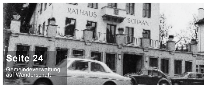
Seite 24 Gemeindeverwaltung auf Wanderschaft