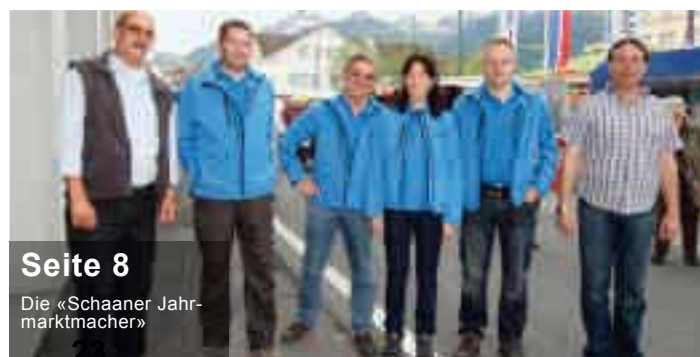
Seite 8 Die «Schaaner Jahr- marktmarker»