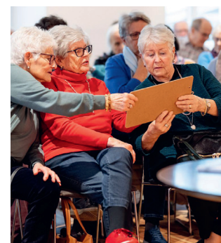
Erzählcafé März 2025

domus Museum und Galerie Landstrasse 19 9494 Schaan