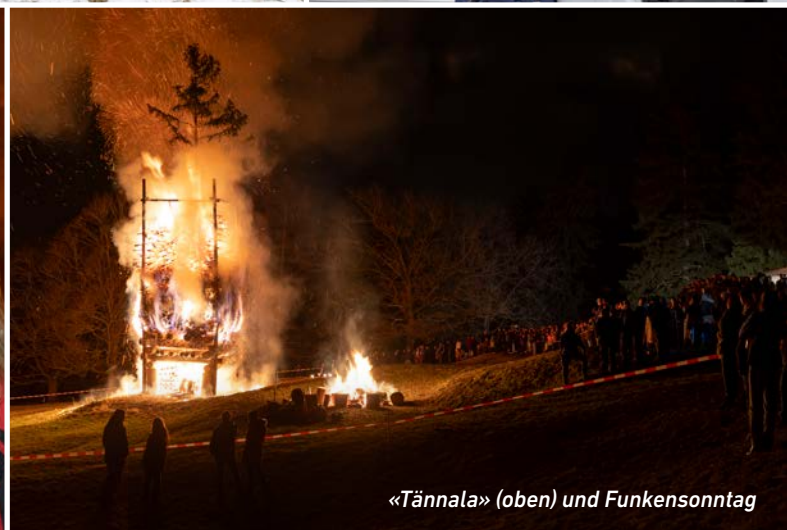
«Tännala» (oben) und Funkensonntag