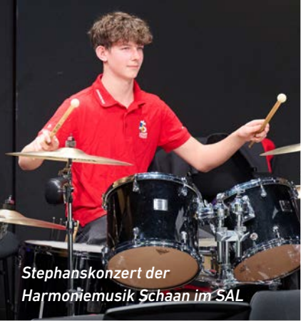
Stephanskonzert der Harmoniemusik Schaan im SAL