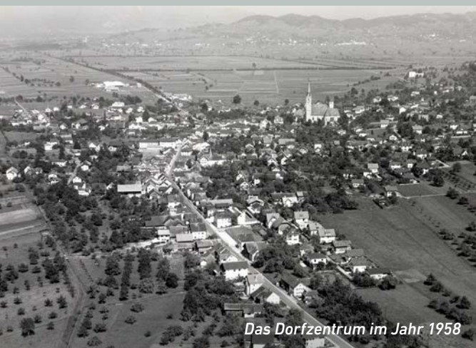
Das Dorfzentrum im Jahr 1958