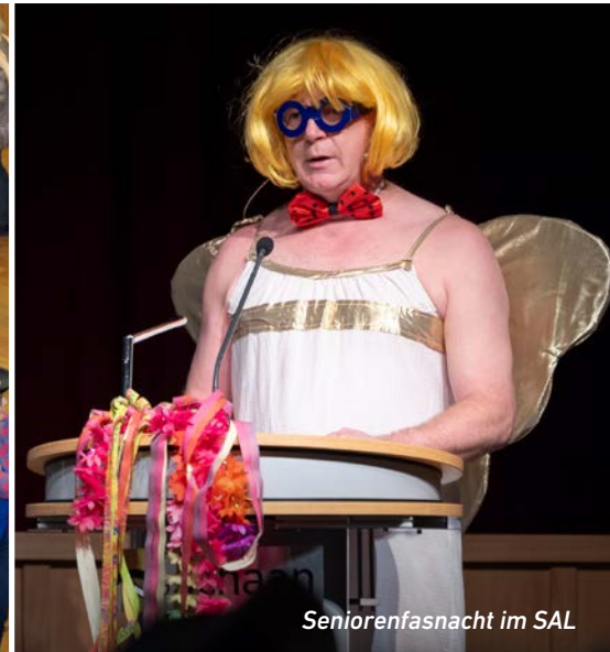
Seniorenfasnacht im SAL