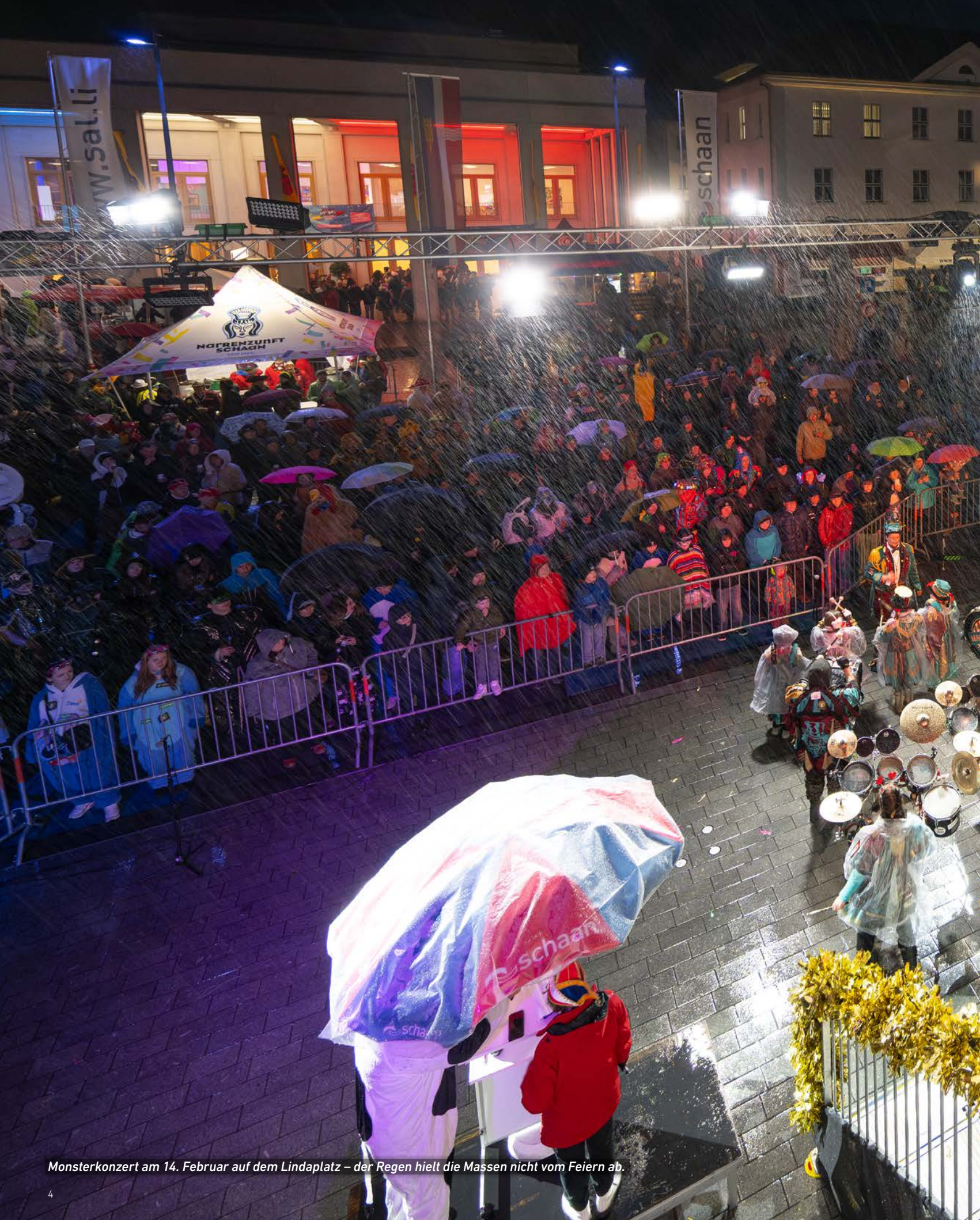
Monsterkonzert am 14. Februar auf dem Lindaplatz – der Regen hielt die Massen nicht vom Feiern ab.