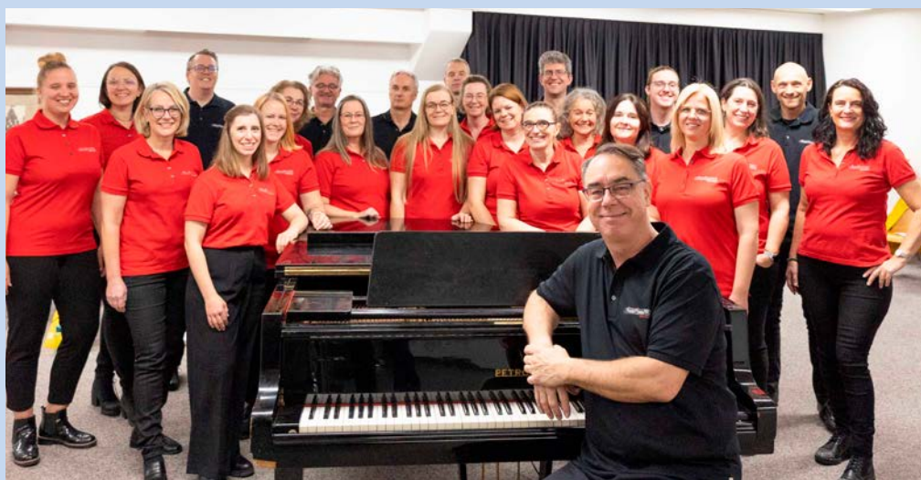
«Divertimento» feiert drei Jahrzehnte seines Bestehens.

Bereits zum 36. Mal lädt der Tanzclub Liechtenstein zu seinem traditionellen Sommernachtsball. Die Gäste werden im SAL ab 18 Uhr mit einem Sektempfang und einem Präsent für die Damen begrüsst. Sie dürfen sich auf einen zauberhaften Abend freuen, an dem sie die festliche Atmosphäre geniessen