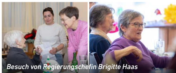
Besuch von Regierungschefin Brigitte Haas