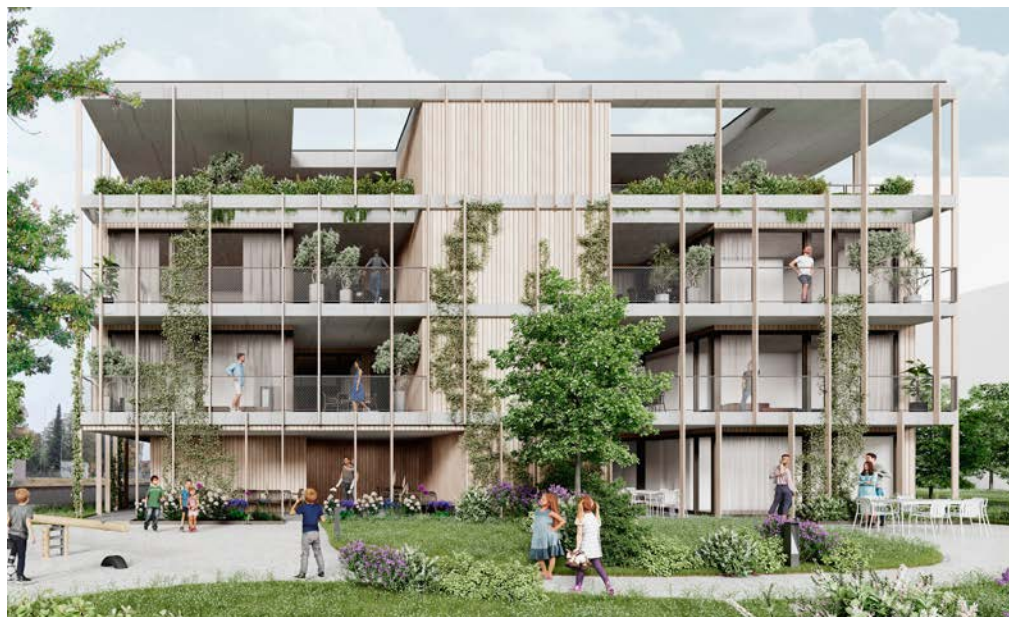
So wird das Projekt «Familiamus» im Jahr 2028 in etwa aussehen.