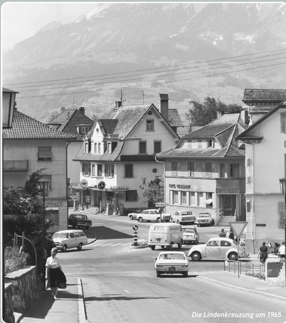
Die Lindenkreuzung um 1965

«Schaan darf im heutigen Fürstentum Liechtenstein als Drehscheibe der Verteilung betrachtet werden. Die gegenwärtig etwa 3500 Einwohner umfassende Ortschaft besitzt eine günstige Lage zu nahen Industriegebieten», heisst es in