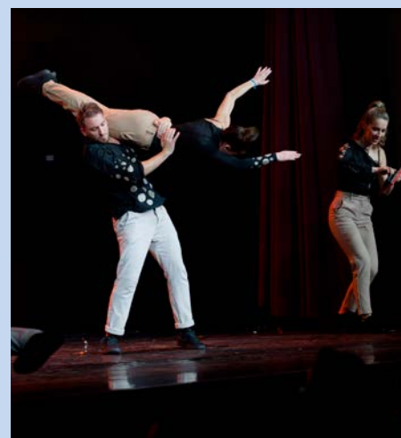
Mitglieder des Tanzclubs Liechtenstein in Action