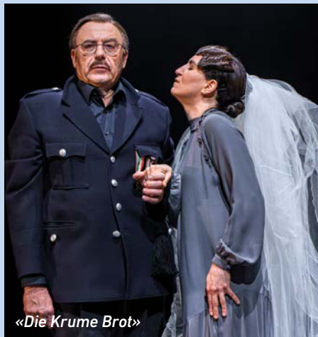
«Die Krume Brot»

Leo Tolstoi Théâtre National du Luxembourg und TAK Theater Liechtenstein Mi/Do 20./21.05. 19.30 Uhr, TAK