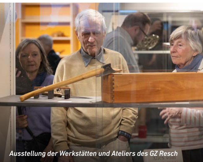
Ausstellung der Werkstätten und Ateliers des GZ Resch