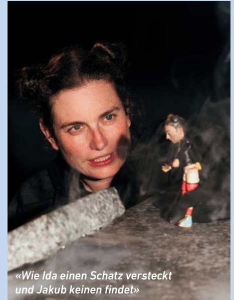
«Wie Ida einen Schatz versteckt und Jakob keinen findet»

Tanztheater (4+) über eine unerwartete Freundschaft Nevski Prospekt, Belgien So 10.05. 16 Uhr, TAK